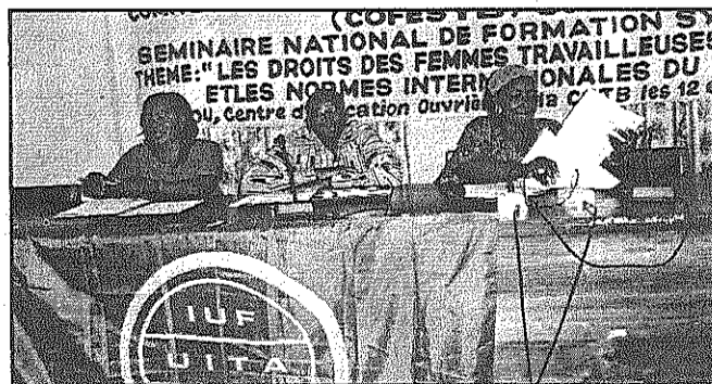
Le podium à l'ouverture des travaux