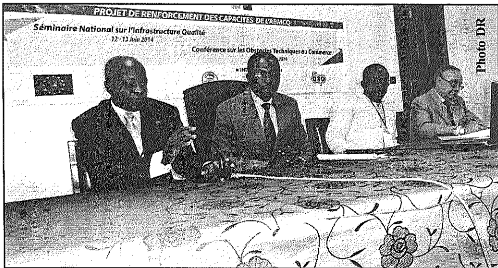
Le présidium à l'ouverture des travaux