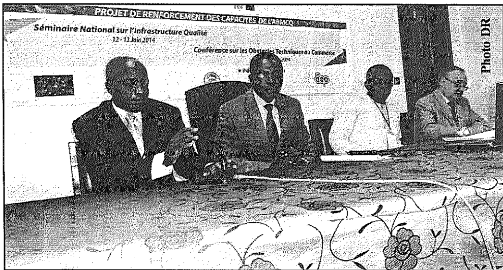
Le présidium à l'ouverture des travaux

consisté à faire visualiser au public une vidéo fondamentale intitulée « Divine comédie », diffusée actuellement à Frankfurt, en Allemagne. Il faut noter que Dominique Zinkpè, né en 1969 à Cotonou, développe depuis plus de vingt ans une œuvre variée et complexe, embrassant un large spectre de médiums-peinture, dessin, sculpture, installation, photographie, vidéo. Connu pour ses installations chocs (Malgré tout à Dakar / Passage d'immigré à Berlin) mais surtout pour ses Taxis-Zinkpè, sortes de ready-made ironiques, bricolés et populaires des taxis et bus surchargés d'hommes et de choses qui circulent en Afrique, Dominique Zinkpè explore les tensions inhérentes à la mondialisation (local-global) en questionnant les manifestations les plus tragiques (SIDA, instabilité politique, immigration forcée), pratiquant ainsi un art sociologique dont chaque pièce fonctionne à la manière d'un kit de communication urgente. Empruntant aux rêves et au monde des esprits, ses peintures et dessins, où des personnages mi-humains mi-animaux s'agitent, se désirent, se battent et se métamorphosent, révèlent la face intime et quasi-mystique de l'artiste.